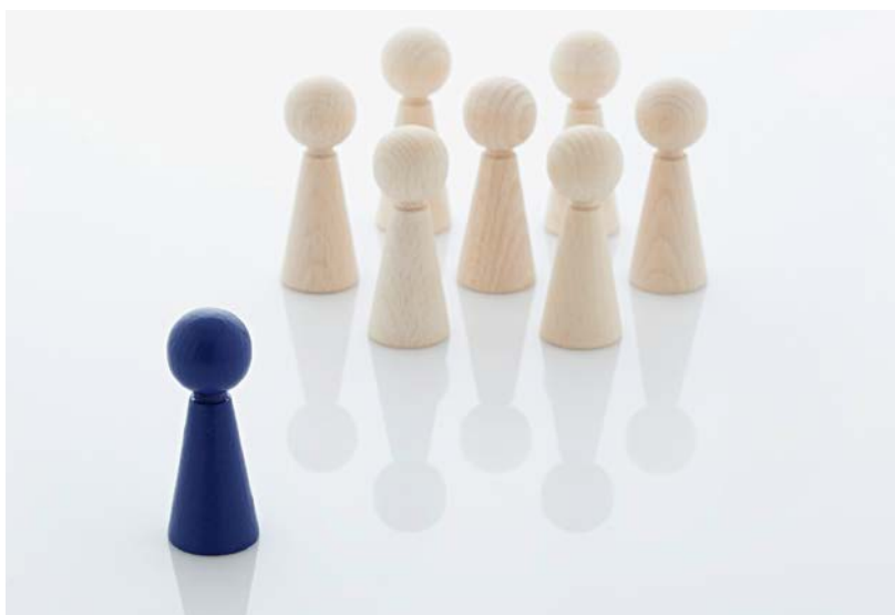
Der Ringelmann-Effekt besagt, dass Menschen in einer Gruppe eine geringere kollektive Leistung erbringen als die erwartete Summe ihrer einzelnen Leistungen

Im Gegenteil, viele Anreizstrukturen fördern unsere Tendenz zur kalkulierten Mindestleistung auch noch. Der sozialistische Wettbewerb ist auch in der sozialen Marktwirtschaft allgegenwärtig: Wer macht für das gleiche Geld am wenigsten? Kooperative Verhaltensweisen bedeuten oft den unbequemen Weg: Abstimmung mit dem Nachbarsteam, Austausch mit dem nächsten Fachplaner? Alles mit